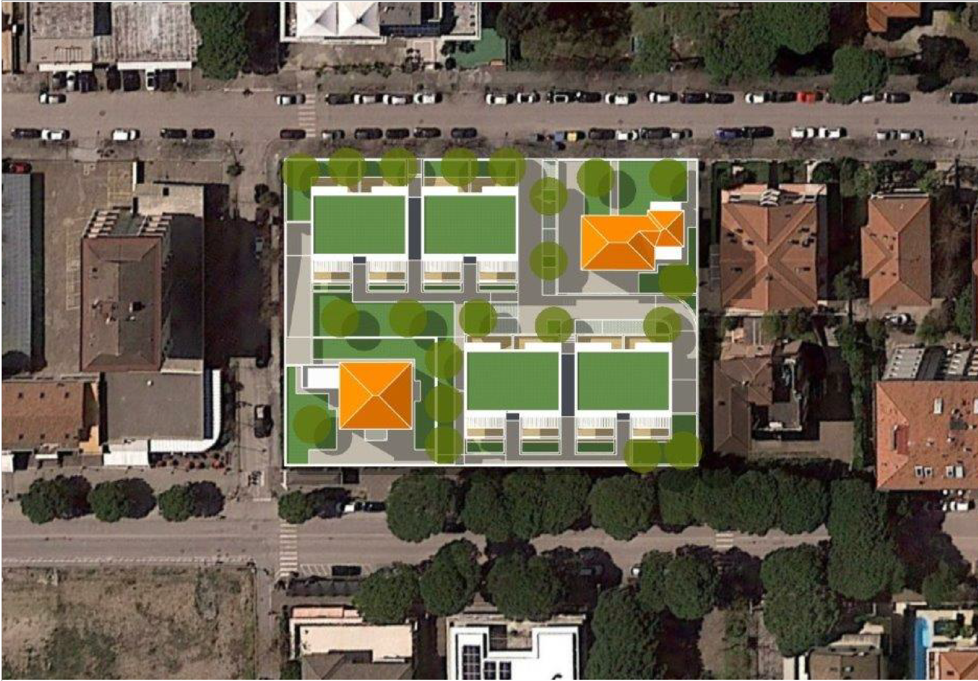
EX COLONIA BONOMELLI - IPOTESI DI SVILUPPO RESIDENZIALE PLANIVOLUMETRICO